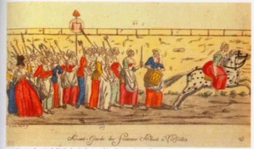
1.1 Anonym, französisch, Die Vorhut der Frauen auf dem Marsch nach Versailles, 1789

Anlass zu dem famosen Ausspruch der Königin Marie-Antoinette: "Warum essen sie nicht Kuchen, wenn sie kein Brot haben?"