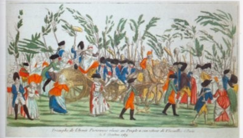
1.2 Anonym, französisch, Rückkehr der Pariser Marktfrauen und der Nationalgarde nach Paris, 1789