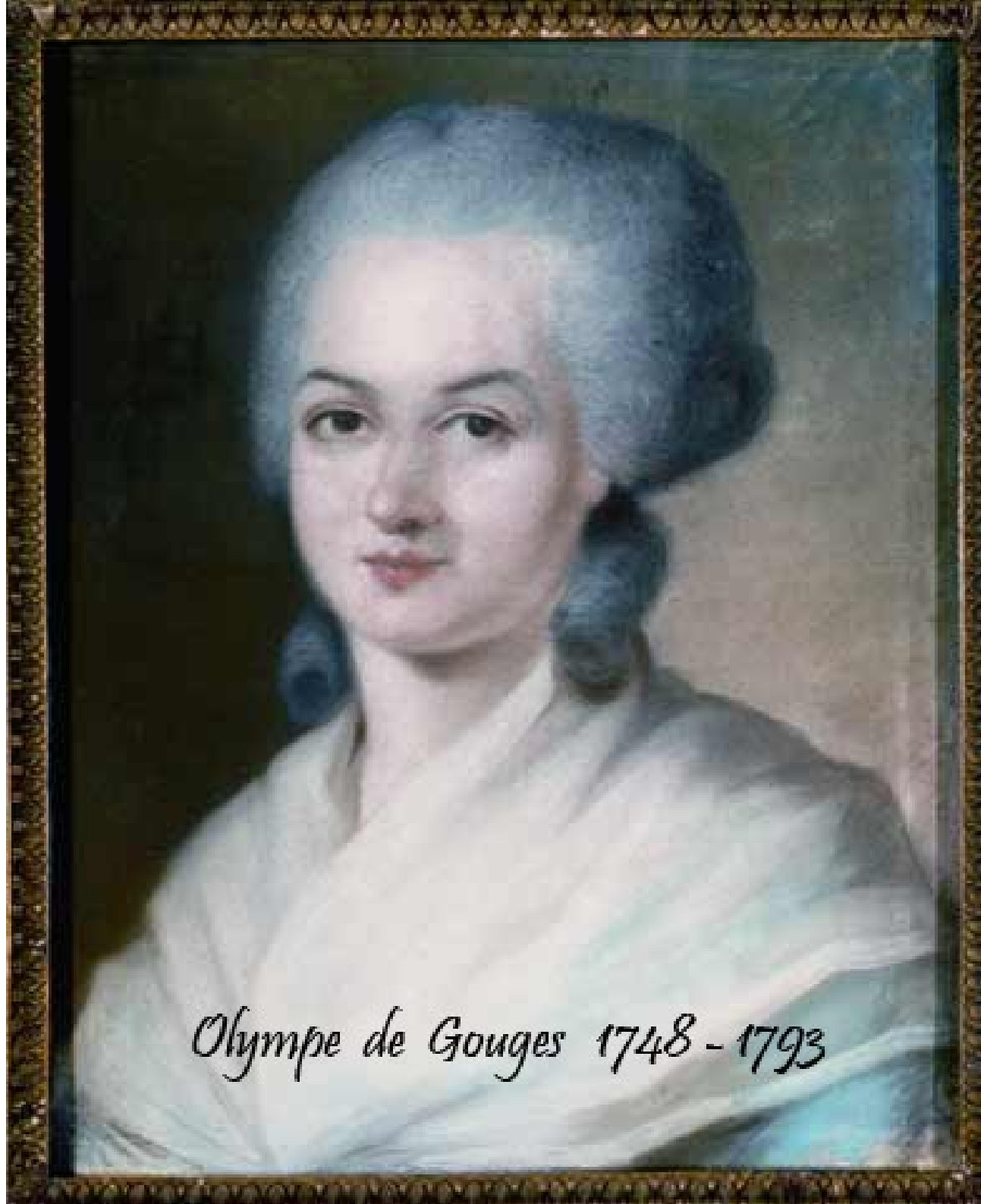
Olympe de Gouges 1748 - 1793